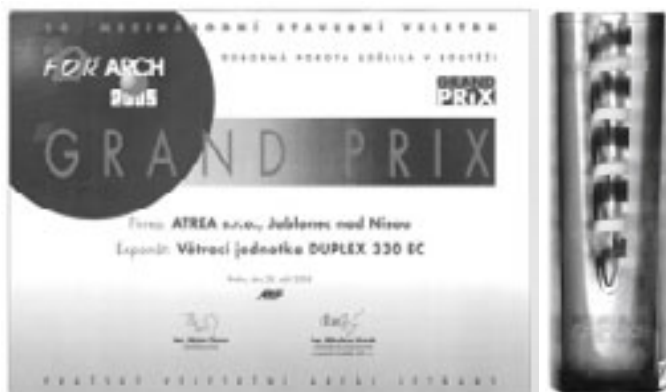
Diplom a GRAND PRIX 16. Mezinárodního stavebního veletrhu FOR ARCH 2005, které si odvezli Jablonečtí...

ventilátory typu EC se vyznačují velmi nízkým příkonem a plynulou regulací otáček s konstantním průtokem pro rovnotlaké větrání prostoru. Vyšší výkony jednotek umožňují nárazové intenzivní odvětrání a letní větrání. Vynikající jsou také tepelně-izolační parametry pláště jednotky s důsledným vyloučením tepelných mostů. Vestavěný by-pass je standardní součástí jednotky a nevyžaduje přídatný prostor. Standardně osazený digitální regulační systém umožňuje komfortní nastavení týdenního režimu, připojení dalších vstupů jako například senzory kvality vzduchu nebo vlhkosti, automatické řízení by-passové klapy podle teploty," sezná-